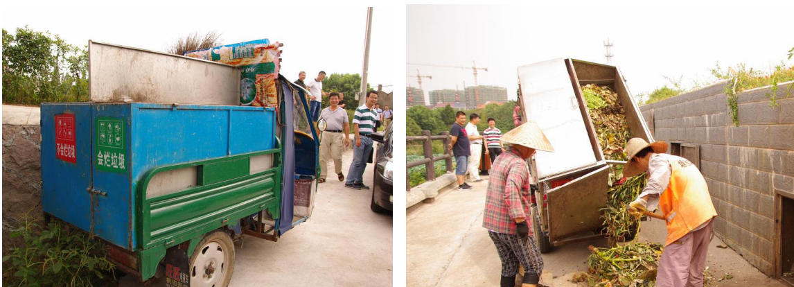
图2 两格式分类收集车

2. 保洁员再分。村保洁员在分类收集各户垃圾的基础上，进行二次分类。一方面，纠正农户分类中的错误；另一方面，对“不会烂的”垃圾再分“好卖的”“不好卖的”两类。保洁员利用两格式分类收集车（图2）将“会烂的”“不会烂的”垃圾集中收运至村内或联村阳光堆肥房。“会烂的”投入堆肥间堆肥。“不会烂的”中“好卖的”投入临时存放间贮存，金华市指定市供销再生资源有限公司对市场上不予以回收的废旧塑料、玻璃等进行“上门、定时、兜底”回收，费用归保洁员所有。既“不会烂”也“不好卖”的垃圾按户集村收镇运县处理”经乡镇转运后由县（市、区）统一处理。