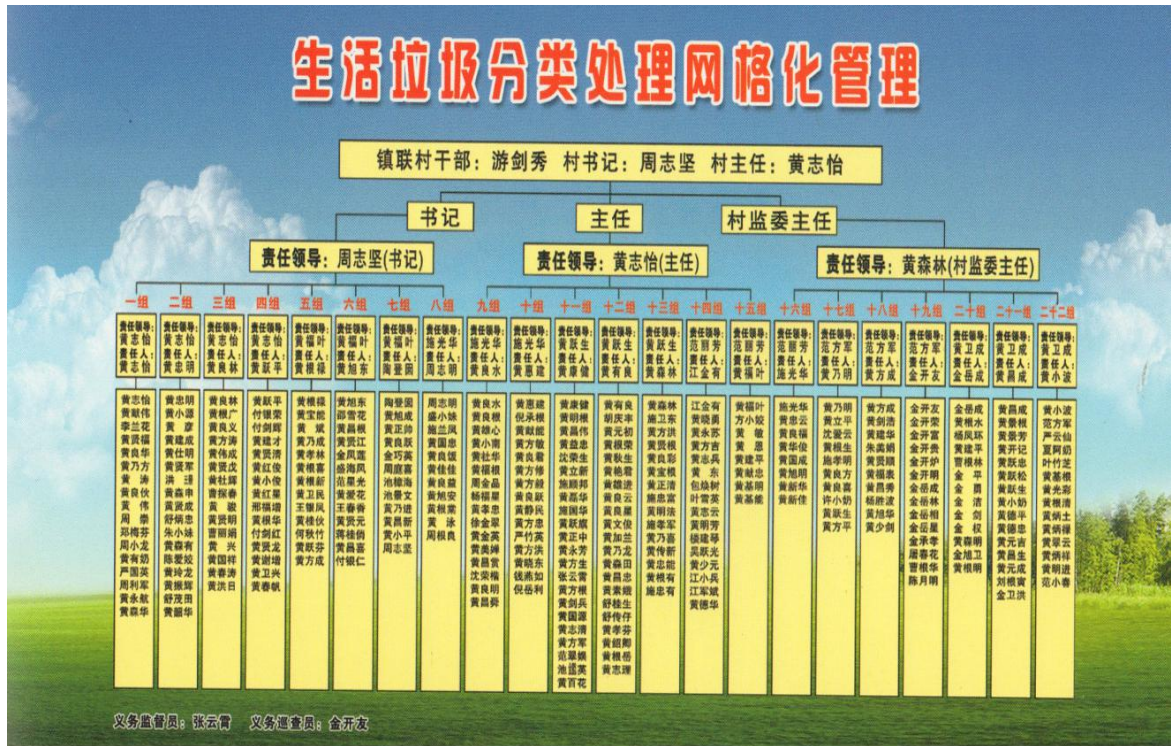
图8 网格化管理制度结构图

钩。村委会和村党员干部层面-实行垃圾分类网格化管理(见图8)。村两委班子成员划分责任片区,每名党员联系若干农户,层层落实责任,确保分类工作有人抓、有人管;实行村务公开,在村庄保洁承包、缴费标准、经费使用等各个环节做到公开透明;聘请村里有威望的老人担任环境监督员和劝导员。保洁员层面-建立分类评优制度(见图9)。实行乡镇对各村保洁员的月度考评制度,每月评比奖励10-20%的优秀保洁员,激发他们做好分类工作。农户层面-建立环境卫生荣辱榜制度(见图10)。村干部、村民代表及有一定威望的老党员、老干部对农户分类等情况进行打分评比,每月每村评出先进户3-10户、促进户3-5户,通过“笑脸墙”“红黄榜”公布结果。健全农户“门前三包”制度,实施卫生费收缴制度,并将其纳入乡规民约。