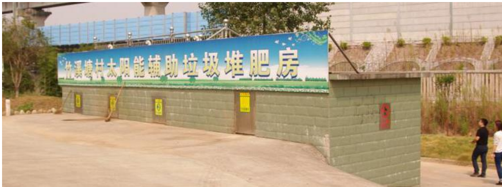
图 4 单村阳光堆肥房

接还田增肥。一般 1 吨会烂垃圾经过堆肥房处理后，一般只剩下 0.2 吨-0.3 吨有机肥，这种有机肥氮磷钾含量都很高，适合做蔬菜瓜果的肥料。