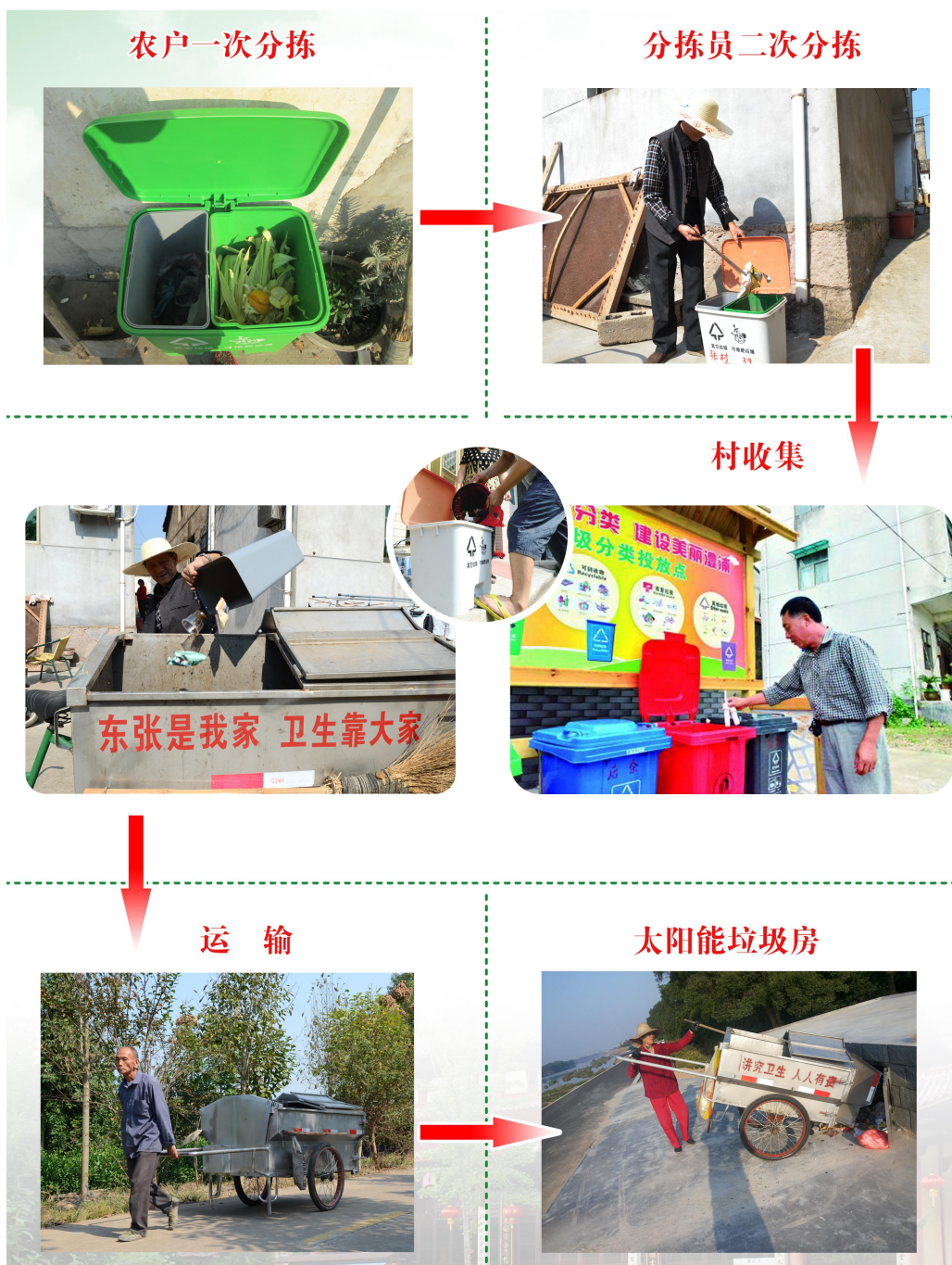
图3 农村生活垃圾收运流程图

通过两次四分法，既解决了农户一次分类不到位的问题，又减少了需末端处理垃圾的总量，还实现了资源化利用。这种分类方法易学易用、易记易分，很接地气，适合农民特点，切合农村实际。澧浦镇后余村是全区试点村，过去每个月要外运垃圾6次，实施垃