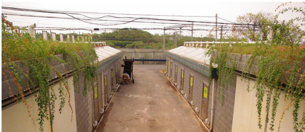
图 5 “多村合建”阳光堆肥房