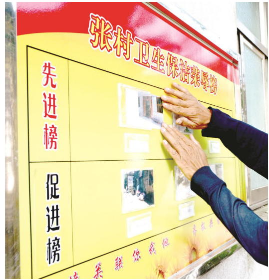
图 10 环境卫生荣誉榜