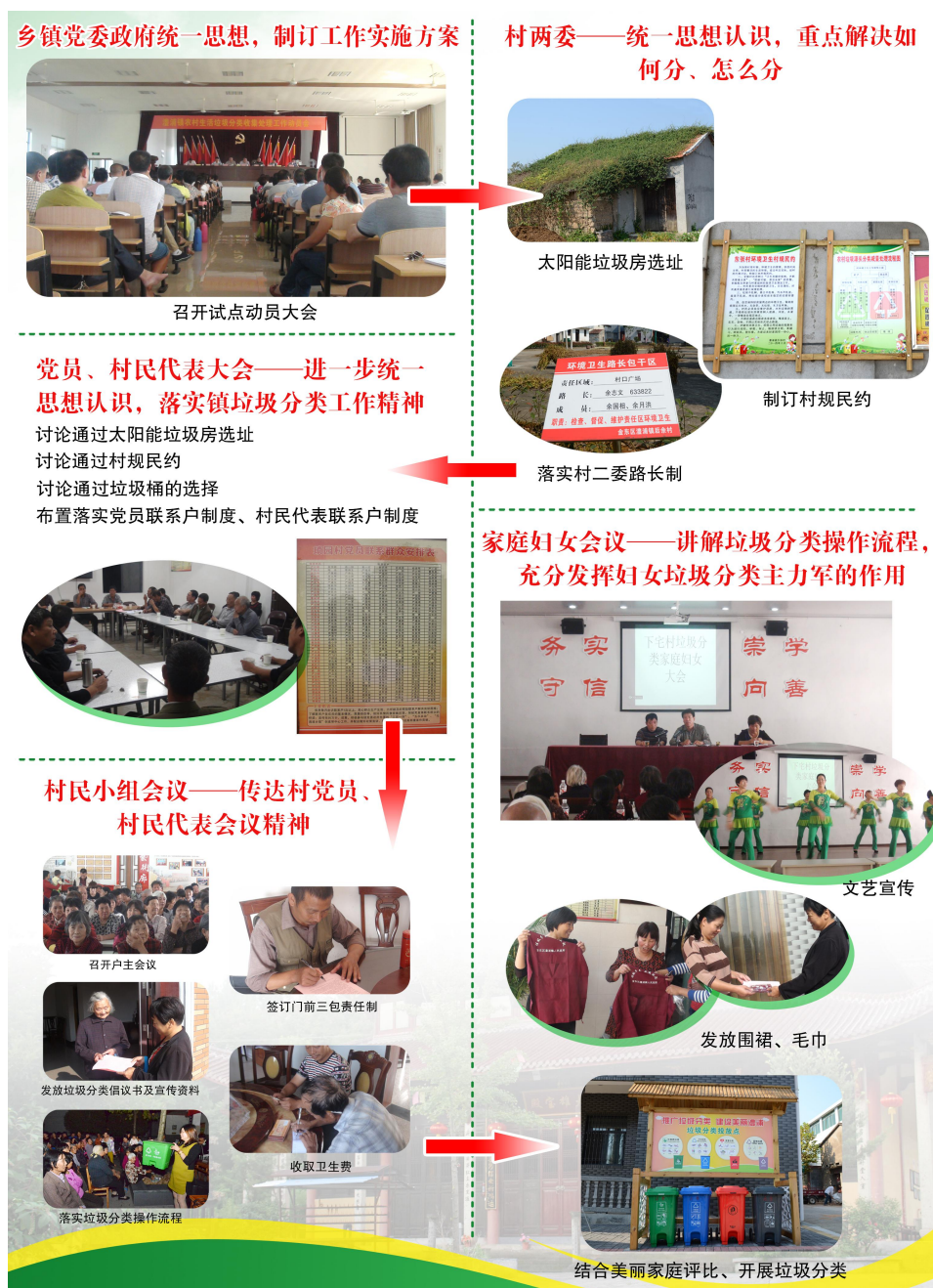
图 11 镇村宣传动员工作流程图

志愿者积极参与分类。教育部门在全市小学全面开展垃圾分类相关知识教育，通过“小手拉大手”等活动，促进农户分类。四是企业积极参与。对于设在农村的各类工厂，明确由各级工会负责，组织开展阳光堆肥房的村企联建、企业职工生活垃圾分类等工作。金华市镇村宣传动员工作流程见图 11。